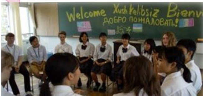
アメリカ、フランス、ロシアの高校生との交流

海外留学生の受け入れや、授業内交流を随時行っています。海外留学生と共に学校生活を送ったり、ホームステイを受け入れることで、異文化を体験し、学ぶことができます♪ 海外語学研修（ニュージーランド）、異文化理解研修（韓国）なども実施しています。