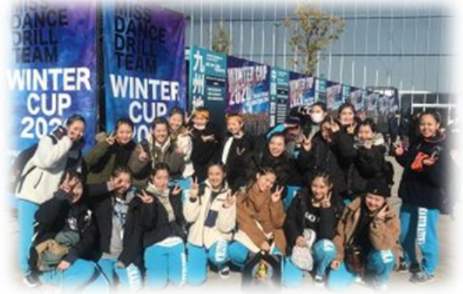
ダンス部 全国大会