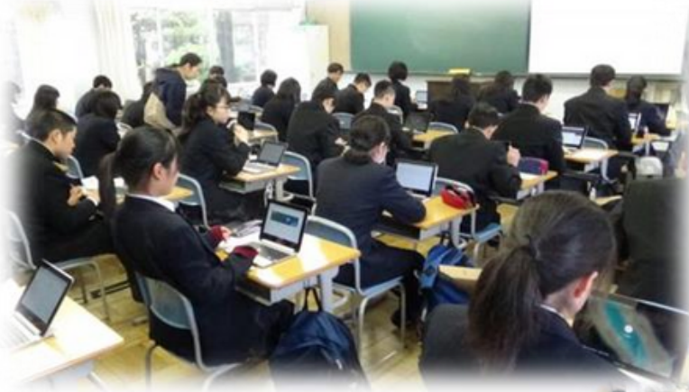
Chromebookを使用した授業の様子