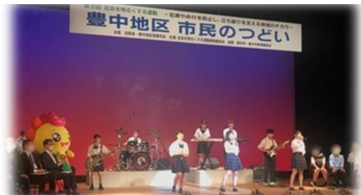
豊中地区市民のつどいにて軽音楽部が演奏