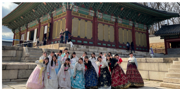
韓国異文化理解研修

隣接している市役所を中心に、豊中市や岡町・桜塚商店街と連携して、様々な活動を行っています。