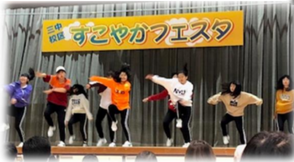
豊中三中のすこやかフェスタに参加