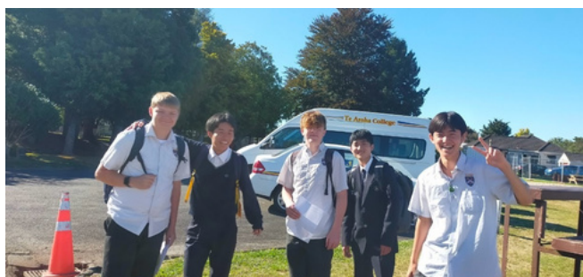
ニュージーランド姉妹校 テ・アロハ高校にて 語学研修