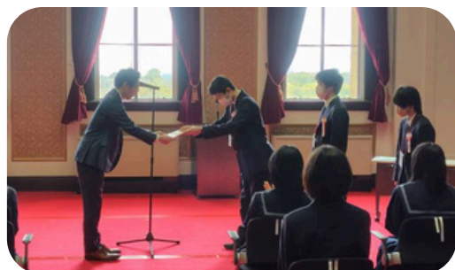
自治会生徒が「こころの再生」府民運動にて表彰されました