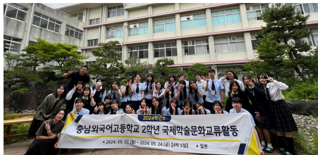
韓国姉妹校 忠南外国語高校生 来校