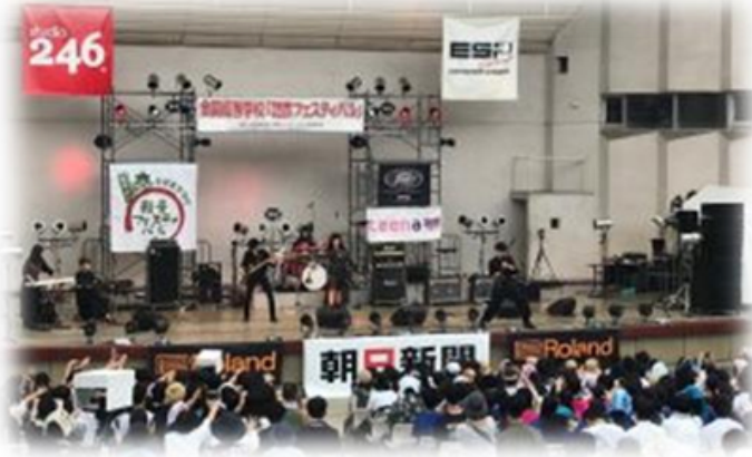
軽音楽部 全国大会