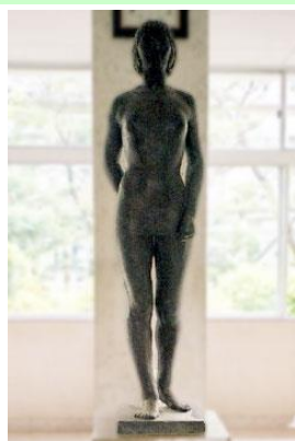
戦争の記憶「ほむら野の像」