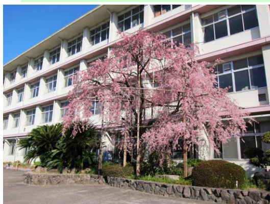
桜塚のシンボル「枝垂れ桜」