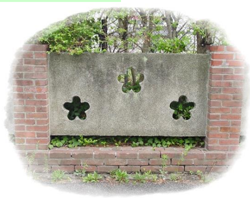
創立時から残る塀は国の有形文化財